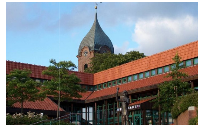
Rathaus Hohenwestedt, Amtssitz