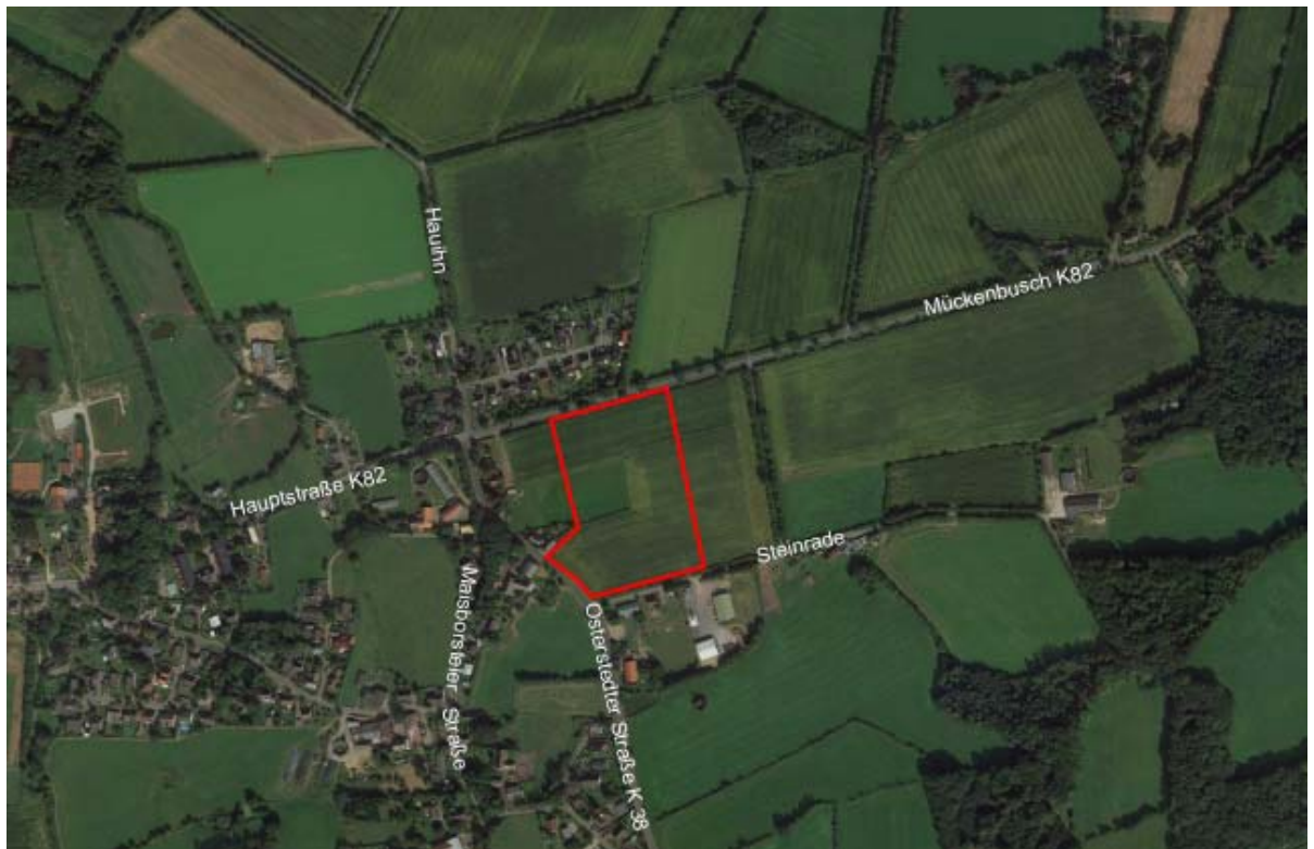
Abb.: Luftbild mit Geltungsbereich (ohne Maßstab)

Das Plangebiet selbst wird derzeit landwirtschaftlich genutzt. Im bauplanungsrechtlichen Außenbereich bestehen Bebauungen im Westen an der Osterstedter Straße, nördlich der Hauptstraße und im Süden / Südosten an „Steinrade“.