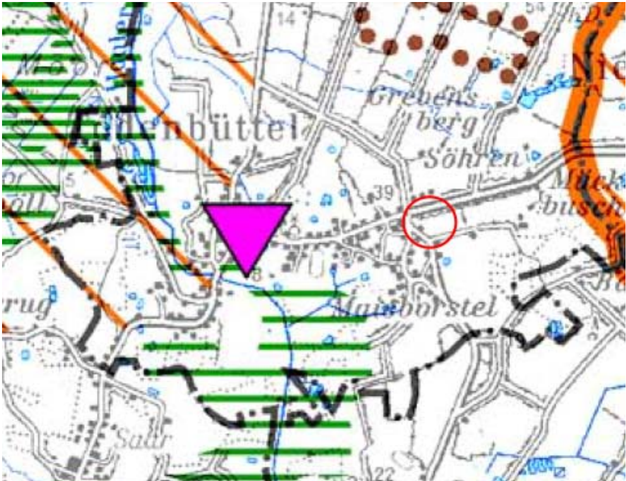
Abbildung 3 - Ausschnitt aus dem Regionalplan (ohne Maßstab)

Im Kartenteil des Regionalplans Planungsraum III (1998) gibt es für den Geltungsbereich der Restgenehmigungsfläche keine Aussagen.